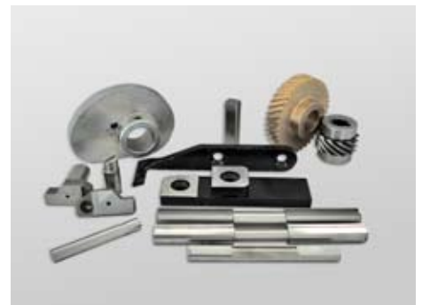
ESMAGADORES, BIGORNAS, PLACAS DE EGUALIZAÇÃO PARA MÁQUINA DE ESMAGAR, EXCÊNTRICAS, CARRETOS E EMPURRADORES PARA MÁQUINA DE AFIAR.