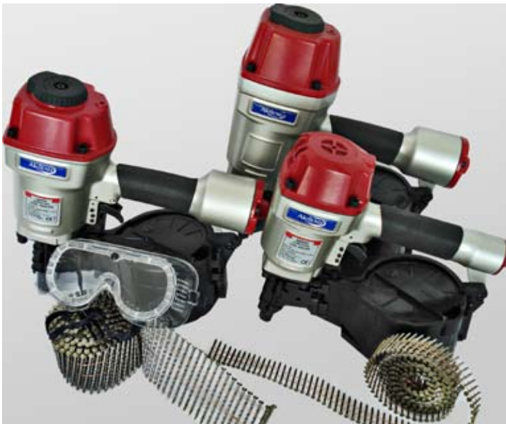
PISTOLAS PNEUMÁTICAS PARA DE PREGAGEM PALETES. PREGO SOLTO, ROLO ELECTROSOLDADO LISO, ROSCADO E ANILHADO