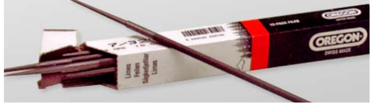
CORRENTES, LÂMINAS-GUIA, LIMATÕES E ACESSÓRIOS PARA MOTOSSERRAS E TRAÇADORES DE TOROS.