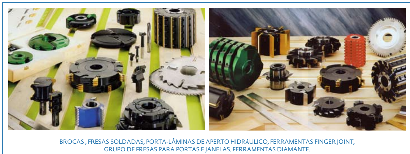
BROCAS , FRESAS SOLDADAS, PORTA-LÂMINAS DE APERTO HIDRÁULICO, FERRAMENTAS FINGER JOINT, GRUPO DE FRESAS PARA PORTAS E JANELAS, FERRAMENTAS DIAMANTE.