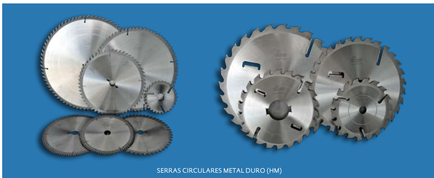
SERRAS CIRCULARES METAL DURO (HM)