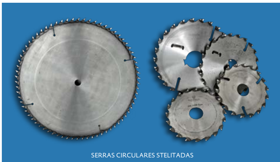
SERRAS CIRCULARES STELITADAS