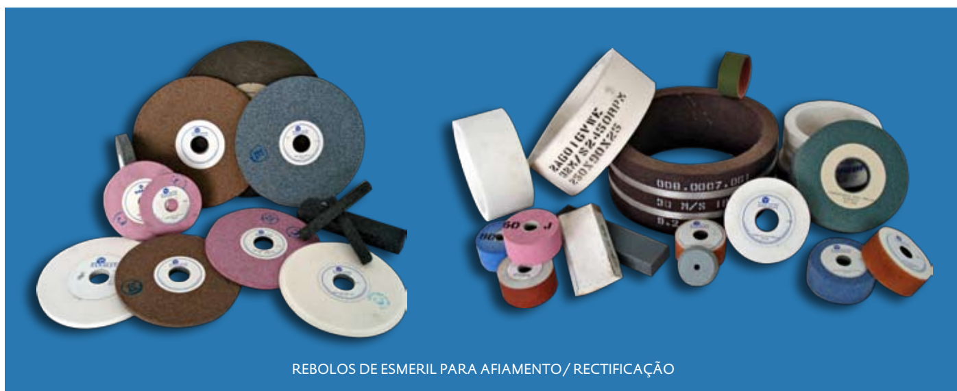
REBOLOS DE ESMERIL PARA AFIAMENTO/RECTIFICAÇÃO