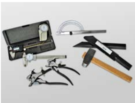
COMPARADOR DE TRAVE, RÉGUA DE VERIFICAÇÃO DE TENSÃO, MARTELO PLANIFICAÇÃO, TRAVADEIRA MANUAL E PECLISE