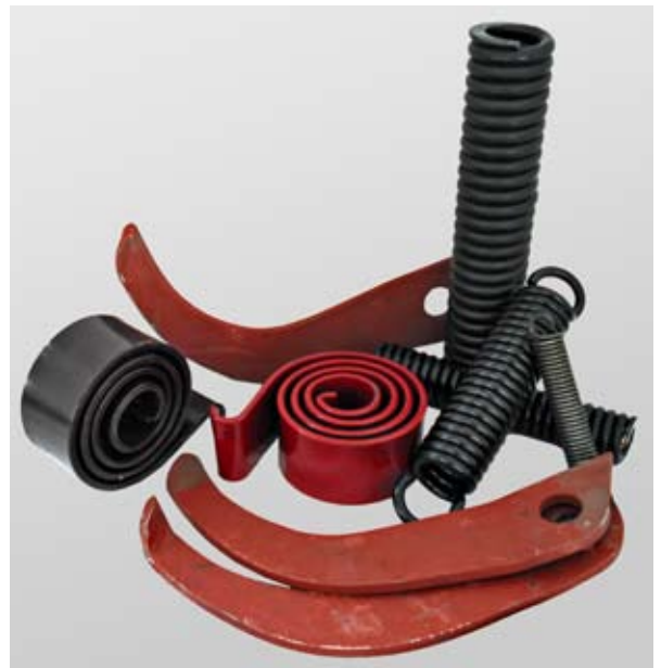
LÂMINAS DE GARRA/CORTE, MOLAS DE CARACOL, MOLAS ESPIRAL P/ APLICAÇÃO EM DESCASCADEIRAS.