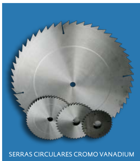
SERRAS CIRCULARES CROMO VANADIUM