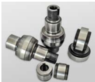
ROLETOS EM AÇO PARA TENSIONADOR